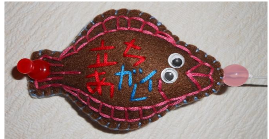
立ちあガレイ ストラップ

昨年11月に行なった、やわらぎ25周年・にんじん15周年創設記念パーティーではNPO法人さくらんぼくらぶの利用者様が製作した「立ちあガレイ」のストラップを記念品として600個を職員に配りました。